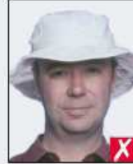
wearing a hat