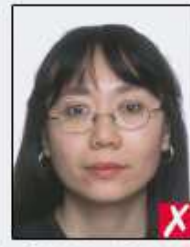
frames covering eyes