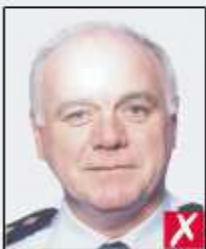
flash reflection on skin