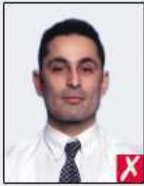
too far away