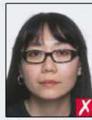
frames too heavy