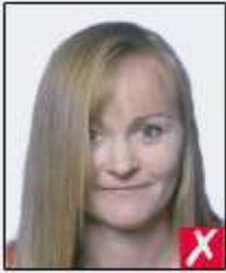
hair across eyes