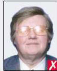
flash reflection on lenses