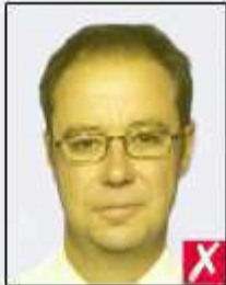
unnatural skin tones