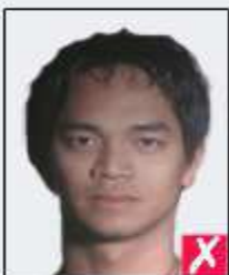
shadows behind head