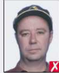
wearing a cap