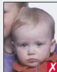
shows another person