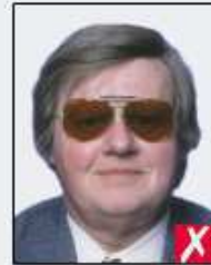
dark tinted lenses