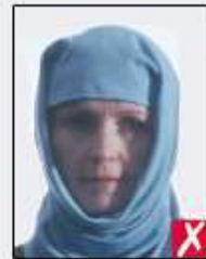
shadows across face