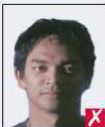
shadows across face