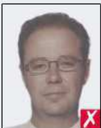
washed out colour