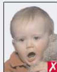
mouth open and toy too close to face